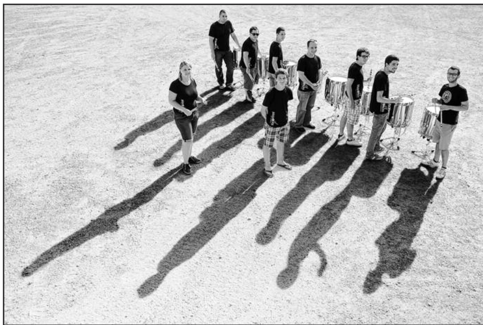
Le groupe Majesticks est composé de dix jeunes âgés entre 15 et 26 ans venant de la Broye et de la région de Neuchâtel. ALAIN WICHT

Entre 4000 et 4500 spectateurs assisteront chaque soir à leur prestation. «C'est vraiment immense!», s'exclament les musiciens lorsqu'ils descendent – certains pour la première fois – à l'intérieur des arènes. «Jouer au Tattoo, c'est de la folie, on ne peut pas avoir mieux!»